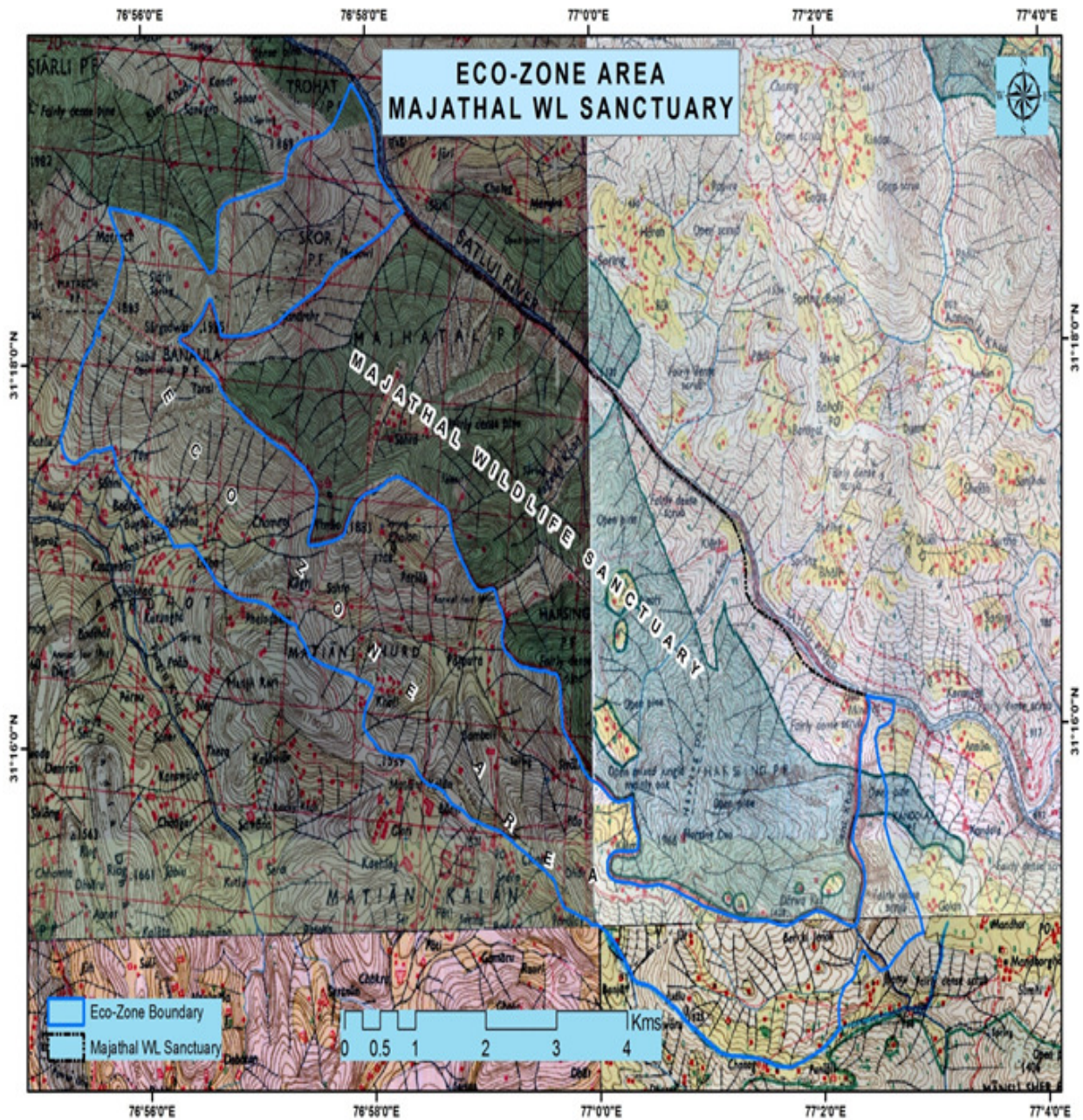
MAP OF ECO-SENSITIVE ZONE OF MAJATHAL WILDLIFE SANCTUARY WITH LATITUDES AND LONGITUDES