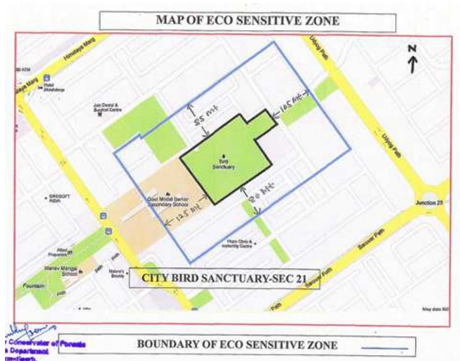
Map of Eco-sensitive Zone boundary of City Bird Sanctuary Union Territory Chandigarh.