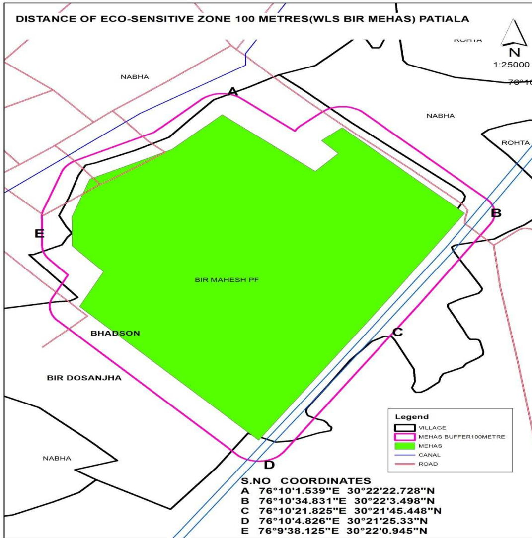
Map of Eco-sensitive Zone boundary of Bir Mehas Wildlife Sanctuary, Punjab together with its latitudes and longitude of extremes and extent.